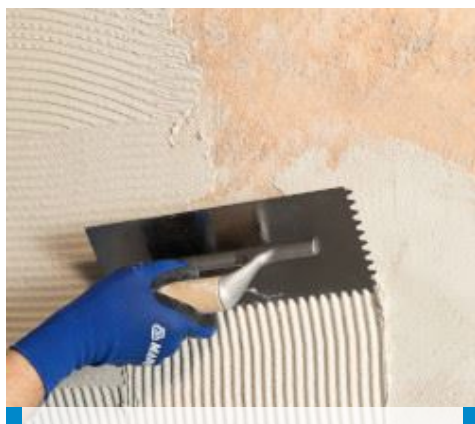
Applicazione di prima mano di Mape-Antique NHL Eco Restaura