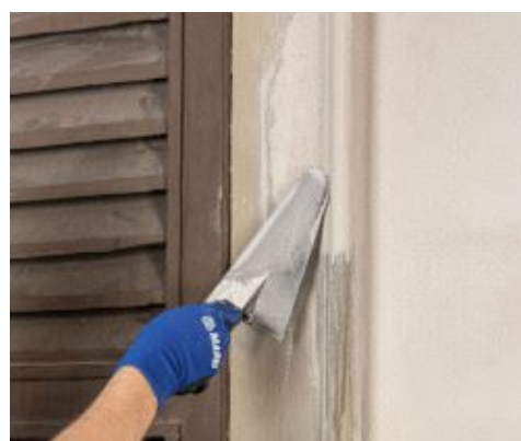
Ricostruzione di elemento costruttivo