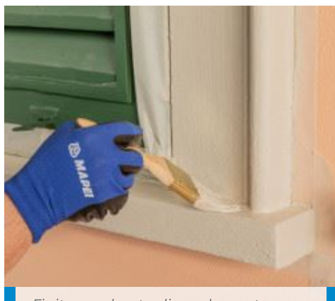
Finitura colorata di un elemento costruttivo