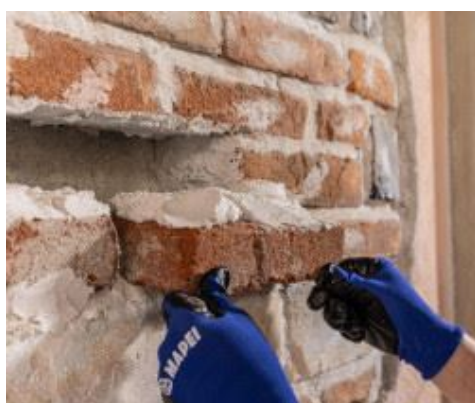
Ricostruzione di muratura in mattoni