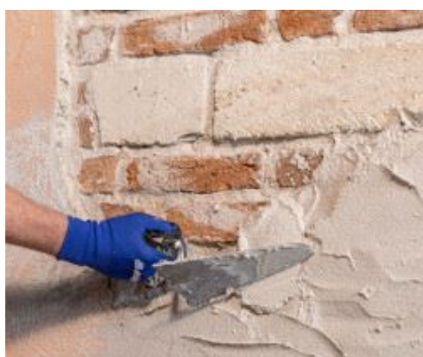
Regolarizzazione e ricostruzione degli intonaci