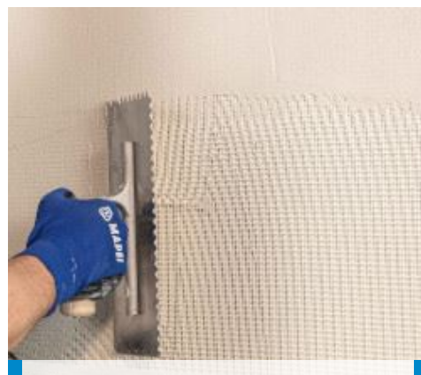
Posizionamento della rete in fibra di vetro A.R. sul primo strato di rasatura