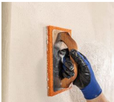
Finitura con frattazzino di spugna