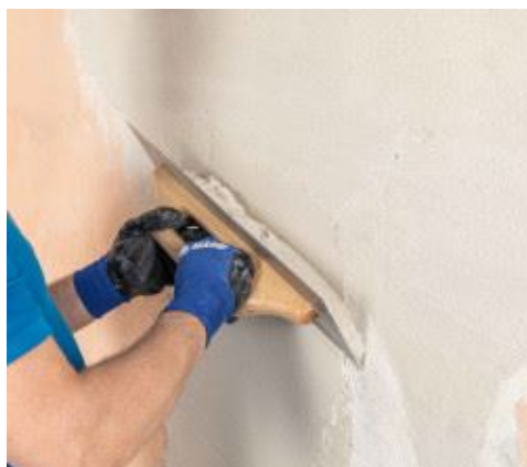
Rasatura di supporti esistenti

Per quanto Mape-Antique NHL Eco Restaura contenga dei prodotti che contrastano la comparsa di microfessure, è buona norma applicare la malta quando la parete da rasare, intonacare o regolarizzare non risulti esposta direttamente a irraggiamento solare e al vento. In questi casi, così come nei periodi dell'anno caratterizzati da alte temperature e/o particolarmente ventilati, è opportuno curare la stagionatura dell'intonaco, soprattutto nelle prime 36-48 ore, nebulizzando acqua sulla superficie o impiegando altri sistemi che impediscano la rapida evaporazione dell'acqua d'impasto.