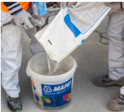
Miscelazione del prodotto

A seguito della variazione di alcune caratteristiche, quali lavorabilità e resistenza, si consiglia di effettuare delle prove preliminari in cantiere o di interpellare il nostro servizio di Assistenza Tecnica.