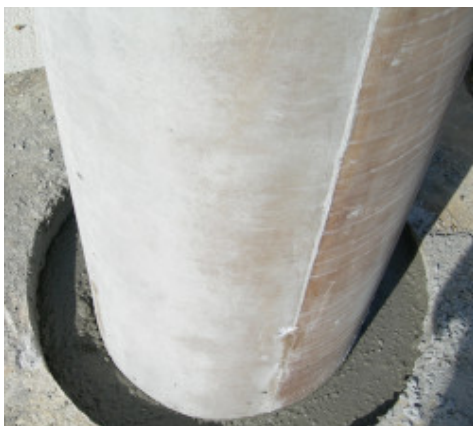
Inghisaggio di pilastro prefabbricato