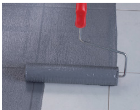
Applicazione a rullo di Eco Prim Grip Plus su pavimento preesistente in piastrelle di gres porcellanato