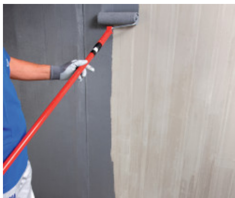
Applicazione di Eco Prim Grip Plus a rullo su supporto in calcestruzzo