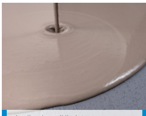
Applicazione di lisciatura autolivellante su Eco Prim Grip Plus asciutto e applicato su vecchio pavimento