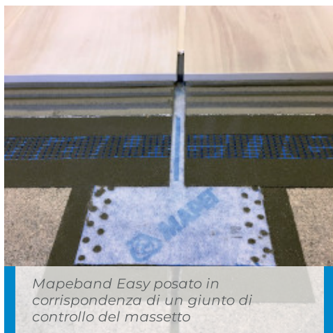
Mapeband Easy posato in corrispondenza di un giunto di controllo del massetto

In tutti i casi, anche quando Mapeband Easy viene completamente rivestito con l'impermeabilizzante, l'eventuale armatura di rinforzo presente fra le due mani di impermeabilizzante, dovrà interrompersi sui lati di Mapeband Easy , così da lasciare libero il sistema di muoversi in corrispondenza del giunto o del raccordo.